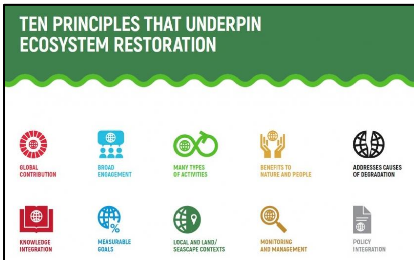
Abbildung 3 (FAO et al., 2021)