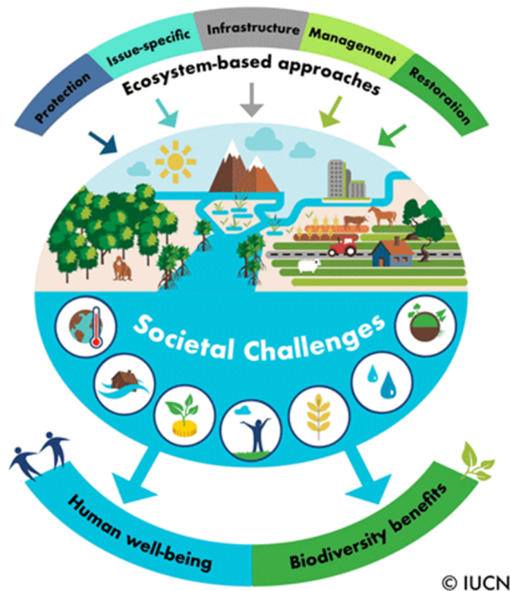
Abbildung 1 (IUCN, 2020) zeigt die Wiederherstellung von Ökosystemen als NbS, welche soziale Herausforderung adressiert und zur Verbesserung der Biodiversität und des menschlichen Wohlbefindens beitragen kann.